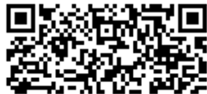
法務部人權搜查客